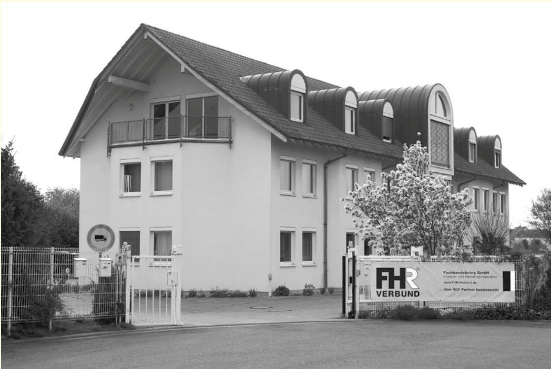
FHR-Zentrale, Harthausen: Die Ideen-Werkstatt