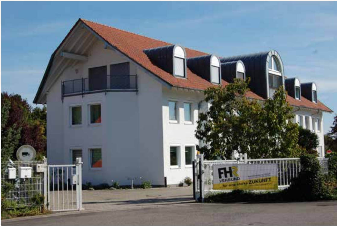
FHR-Zentrale, Harthausen: Die Ideen-Werkstatt